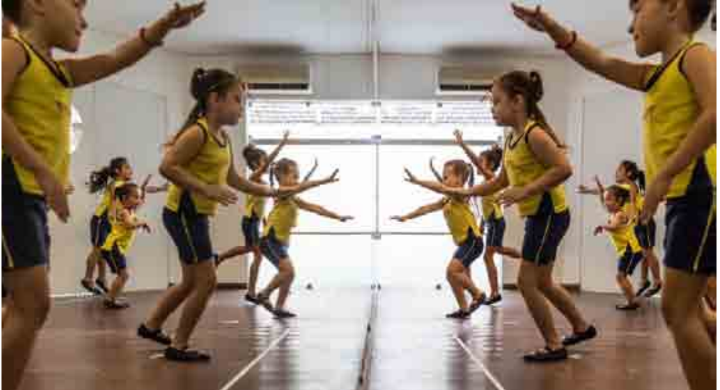
فتيات يتعلمن الرقص، ريسيفي، البرازيل.