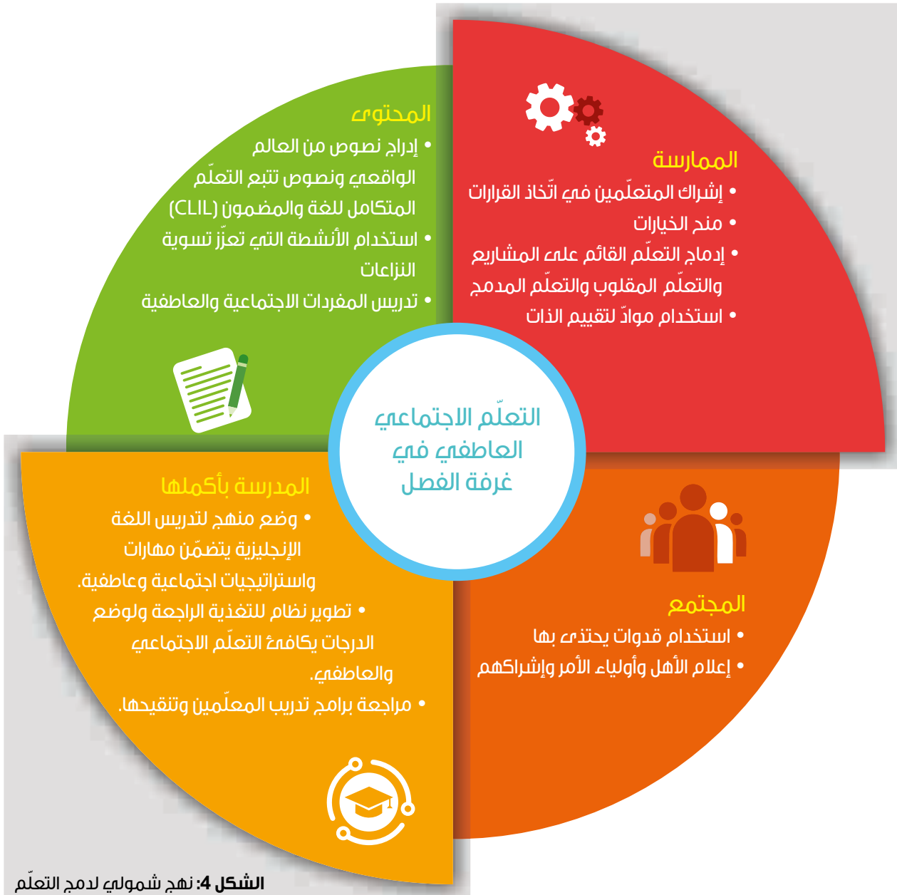
الشكل 4: نهج شمولي لدمج التعلّم الاجتماعي العاطفي في اللغة وتعلّمها.