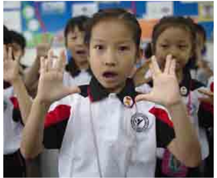
تلاميذ يؤدّون تمارين الصباح، مدينة شنجن، الصين.

إنني أهدف من خلال هذا البحث إلى إثبات أن تنمية المهارات الاجتماعية والعاطفية هو عامل يرتبط ارتباطاً وثيقاً بتحقيق التلاميذ النجاح الأكاديمي، كما أنه يؤثر بشكل إيجابي في سلامة التلاميذ العقلية والسلوكية على المدى البعيد. سأقدم أيضاً اقتراحات حول السبل التي يمكننا من خلالها بصفتنا معلمين، وتربويين، وأولياء أمور، وصنّاع قرار، دعم تنمية مهارات التلاميذ الاجتماعية والعاطفية، والتشجيع على الاعتراف بأهميّة هذه المهارات في العملية التعليمية.